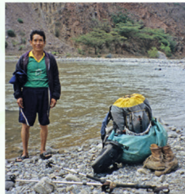
Der Helfer, Foto Gregor Sieböck.

Dieser musste alles Notwendige beherbergen für lange Wanderstrecken, ohne Geschäfte oder Dörfer am Wegesrand.