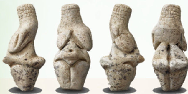
Venusfigur aus der Steinzeit

Die Archetypen, die bei vielen um die Lebensmitte wirken, sind der Zerstörer und der Schöpfer und es herrscht eine ähnlich aufregende Stimmung wie in der Pubertät. Man sortiert Abgestandenes aus und kreiert Neues. Für die Indianer sind die Wechseljahre das Tor zur weisen Frau. Etwas, worauf man sich freuen kann!